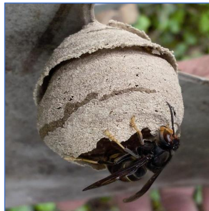
Nid primaire de frelon asiatique

Au printemps, les reines de frelons asiatiques construisent les pré-nids (ou nids primaires). A ce stade, les nids sont de petite taille, équivalente à une orange, et la reine est seule à l'intérieur. C'est le moment le plus propice pour intervenir et limiter le développement d'une colonie.