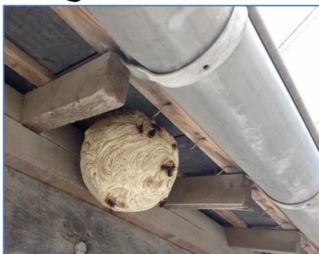
Nid primaire sous une gouttière

Dans un premier temps, prenez contact avec votre mairie.